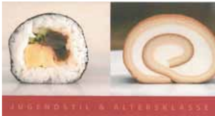
Gegensatzpaare der Ausstellung Jugendstil und Altersklasse