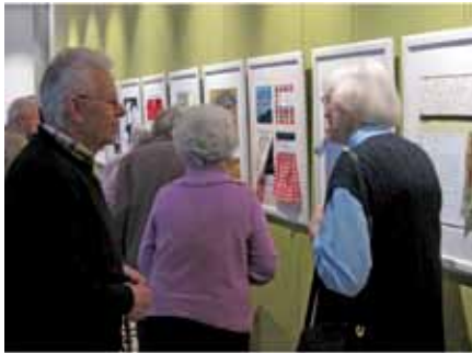
Aus der Ausstellung ErinnerungsStoff

Von Anfang an begleiten uns Stoffe durchs Leben. Das Knistern von Taft, das Kratzen von Wolle, das kühle Gefühl von frisch gewaschener und gemangelter Bettwäsche... Viele Erinnerungen werden wach durch das Anschauen und Befühlen verschiedener Textilien.