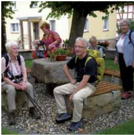
Pilger vor einer Kirche