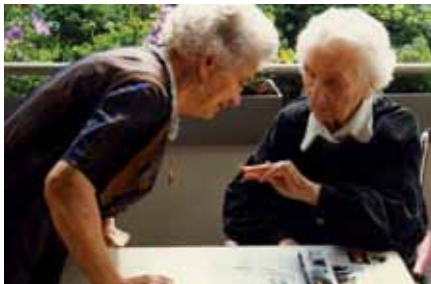
Anregendes Gespräch bei einem Besuch

Besuche bei alten Menschen erhalten eine immer größere Bedeutung, da der Anteil hilfs- und pflegebedürftiger Menschen zunimmt. Der Hamburger Senat unterstützt diese ehrenamtliche Arbeit, indem er Einführungskurse finanziert, die von unterschiedlichen Trägern durchgeführt werden.