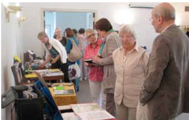
Kulturbotschafter/innen präsentieren ihre Koffer nach Beendigung des ersten Seminars

Im Angebot sind unter anderem folgende Themen: Hamburgs Sprung über die Elbe, Jazz mit Swing, England und