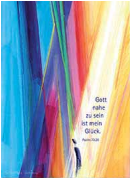
Foto: Karte zur Jahreslosung